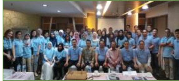
27-28 Agustus 2019, In House Training Avrist Asset Management "Bond Market & Instruments"