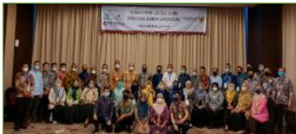
28-29 Maret 2022, In House Training World Bank "Municipal Sukuk Issuance"