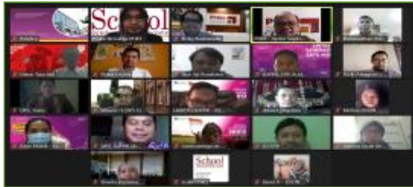
01-04 September 2020, In House Training Kementerian Keuangan "Bond Market Analysis"