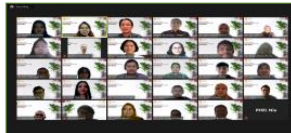
29-30 Juli 2021, In House Training Lembaga Penjamin Simpanan "Bond Issuance"